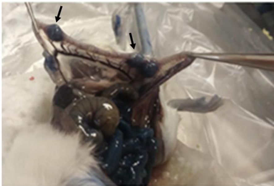
شکل ۱- رنگ‌آمیزی با ایوانس بلو. نقاط برجسته مشخص شده با فلش، رویان‌های لانه‌گزینی شده را نشان می‌دهند.