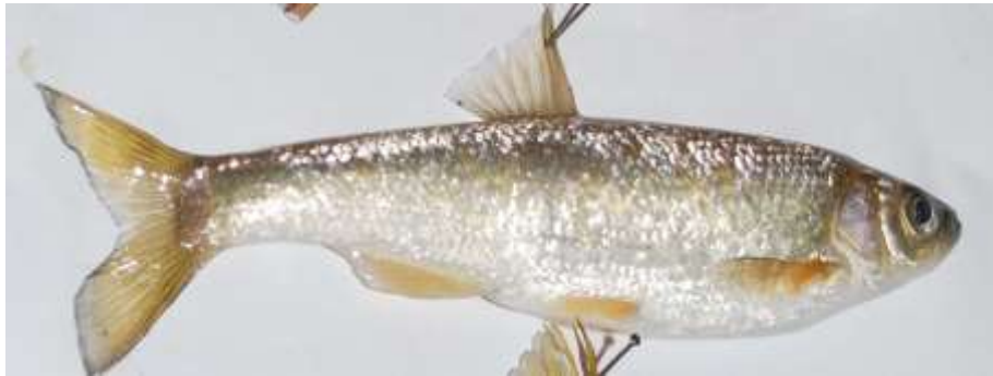
شکل ۷- ماهی برگ بیدی Chalcalburnus sellal