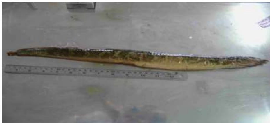
شکل ۱۰- مارماهی آب شیرین Mastacembelus mastacembelus