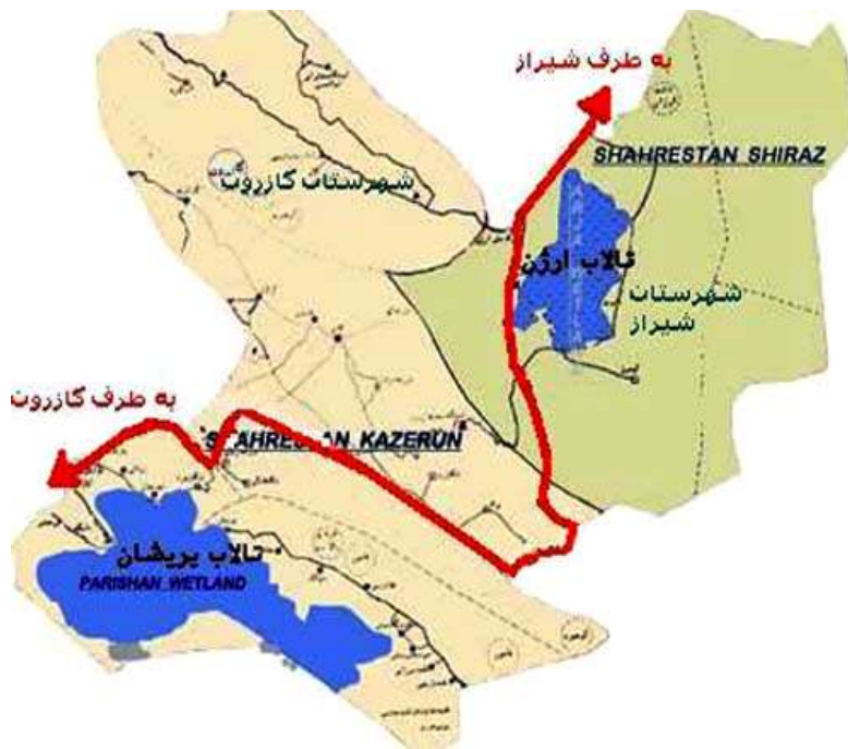
شکل ۱- وضعیت جغرافیایی دریاچه پریشان