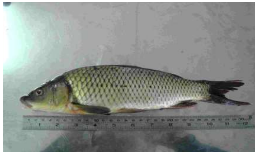
شکل ۵- ماهی کپور معمولی Cyprinus carpio