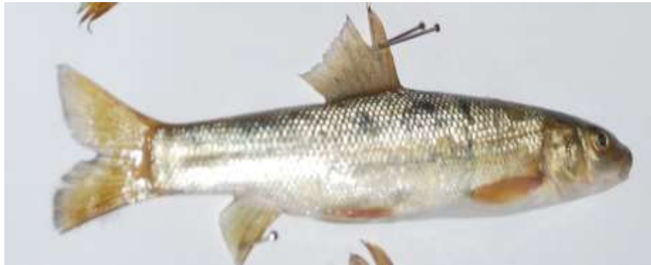
شکل ۶- ماهی دشت ارژنی capoeta barroisi persica