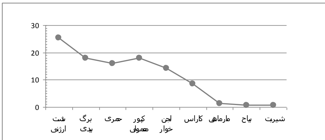
نمودار ۱- میانگین فراوانی ماهی‌های صید شده در دریاچه پریشان در طول سال