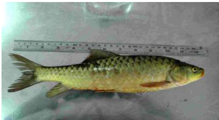
شکل ۲- ماهی حمری Barbus luteus