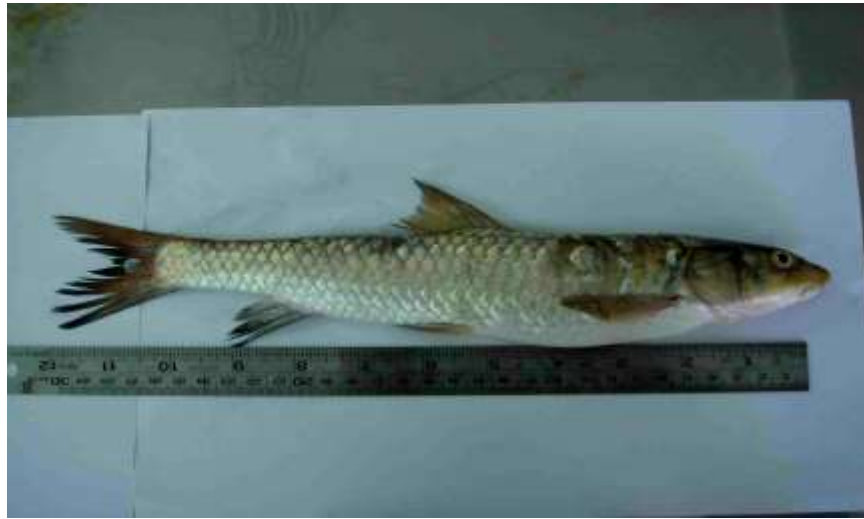
شکل ۳- ماهی شیربت Barbus grypus