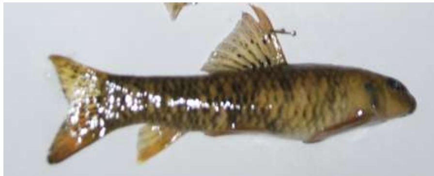
شکل ۸- ماهی لجن خوار Garra rufa obtuse