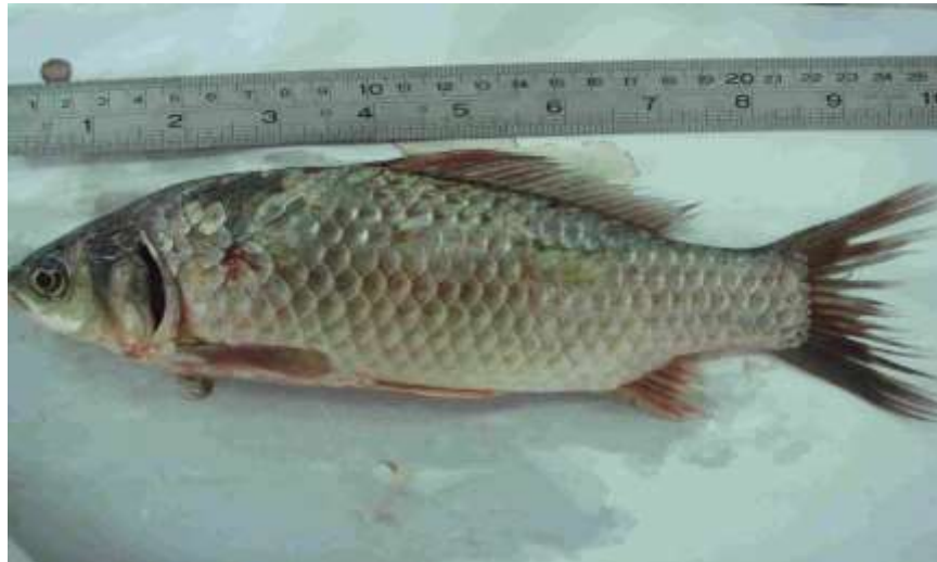
شکل ۴- ماهی کاراس Carassius carassius