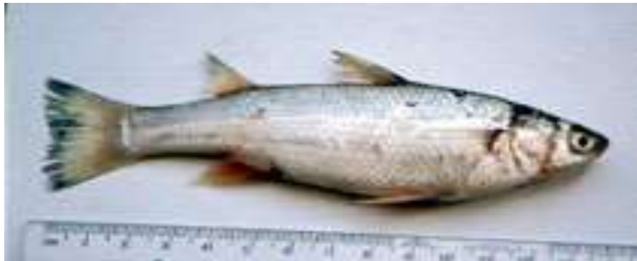
شکل ۹- ماهی بیاح Liza abu